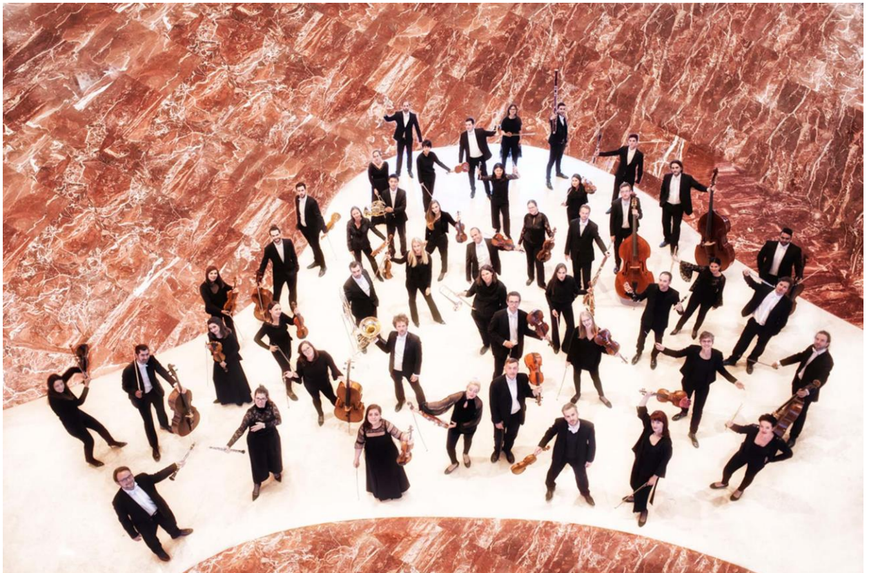
Philharmonie Salzburg